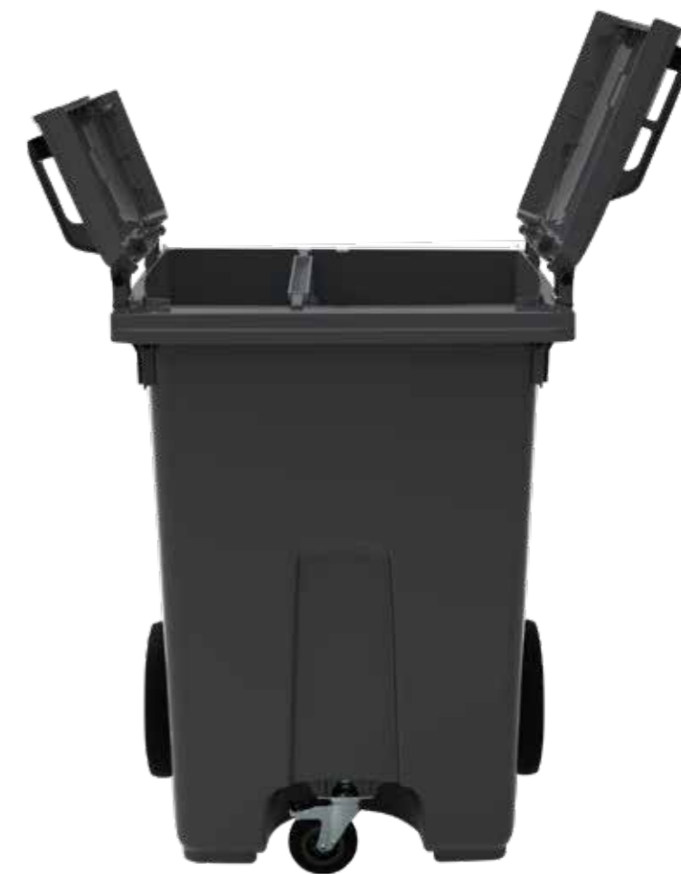
Öppet Flip lid på 370L kärlet

Flip Lid möjliggör effektiv tömning, eftersom locken öppnar sig själva under tömningen. Dessutom kan kärlet roteras med handtaget utåt och ändå enkelt hanteras av renhållaren. Hanteringen är praktiskt och effektivt.