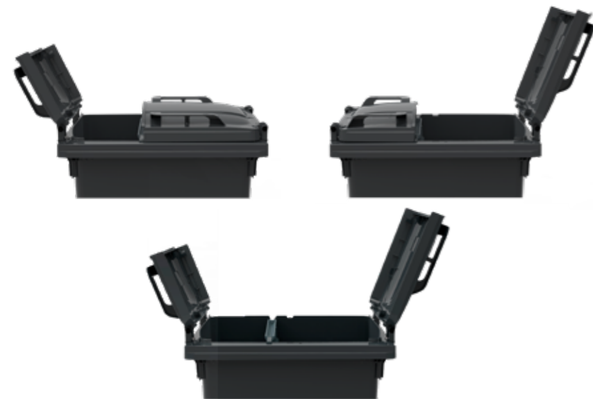
Flip lid öppet på alla 3 sätten

Flip lid kan öppnas och hållas i ca. 95°, men kan även öppnas helt med ett lätt tryck - t.ex. i kontakt med bilen. Med Flip Lid kan användaren enkelt öppna locket från alla fyra sidor med bara en hand.