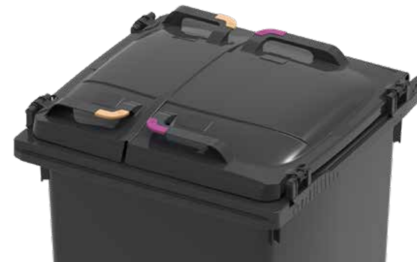
Flip lid monterat med PAPPER och PLAST clips

Flip Lid är uppdelat i mitten, men för att hindra vatteninträning har klafflocket en överlappning. Överlappningsfunktionen gör att Flip Lid kan användas med både 1-fraktionsbehållare och för uppdelning i både 40/60 och 50/50.