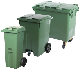
2-, 3- och 4-hjuliga kärl