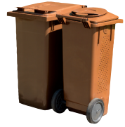
Ventilerade kärl för organiskt