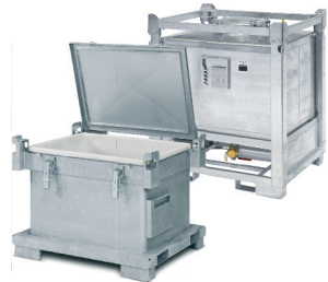
Kärl för farligt avfall