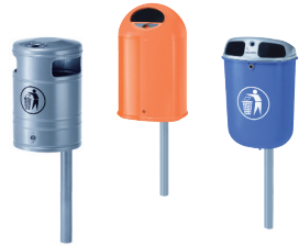
Papperskorgar, olika utföranden