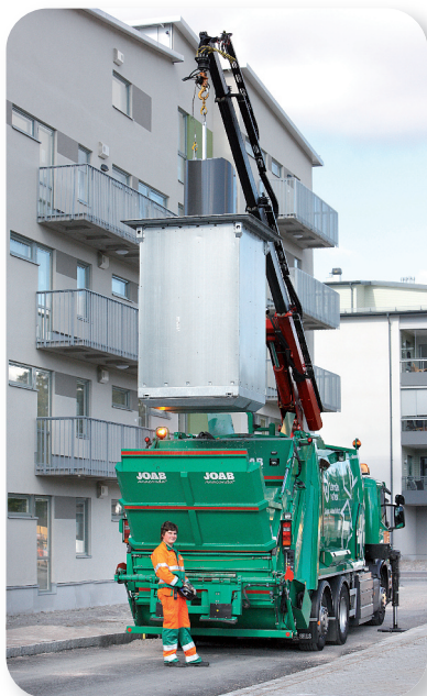
Tömning av UWS