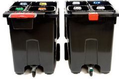
Quattro Select 4-fackssystem