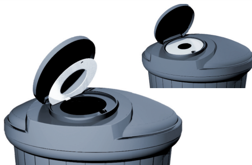
Bagio inkast med barnsäkerhetsspärr med hänglås och självstängande lock